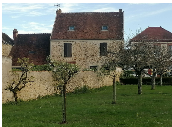
Plantation de pommiers dans le verger de la mairie