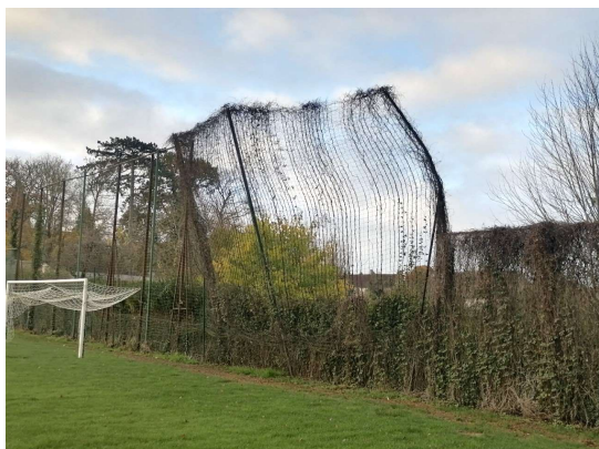
Remplacement du pare-ballon sur le stade avec création d'un portillon