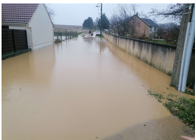
Chemin de la gillette