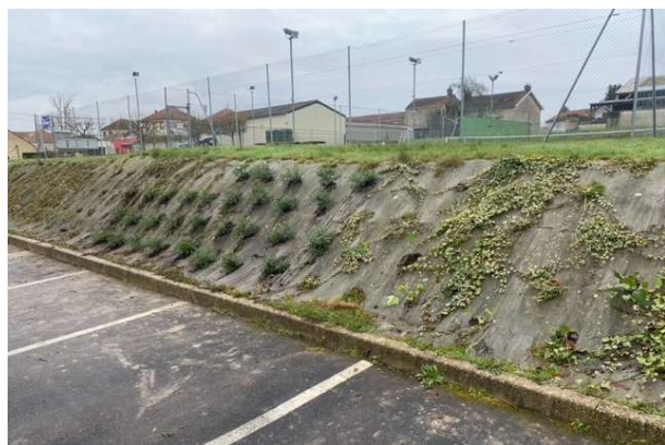
Plantation du talus du terrain de tennis