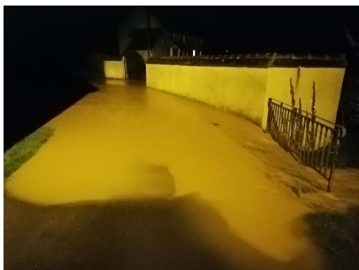
Rue du ruisseau