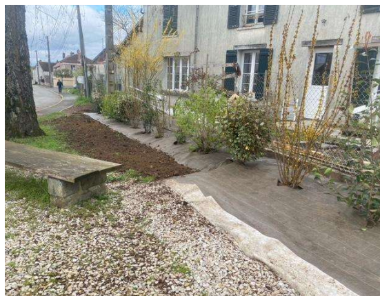
Remplacement des thuyas par une haie fleurie au Monument aux Morts