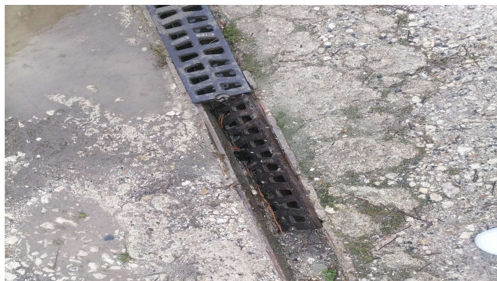
Remplacement d'un caniveau « rue du clos Gillet »