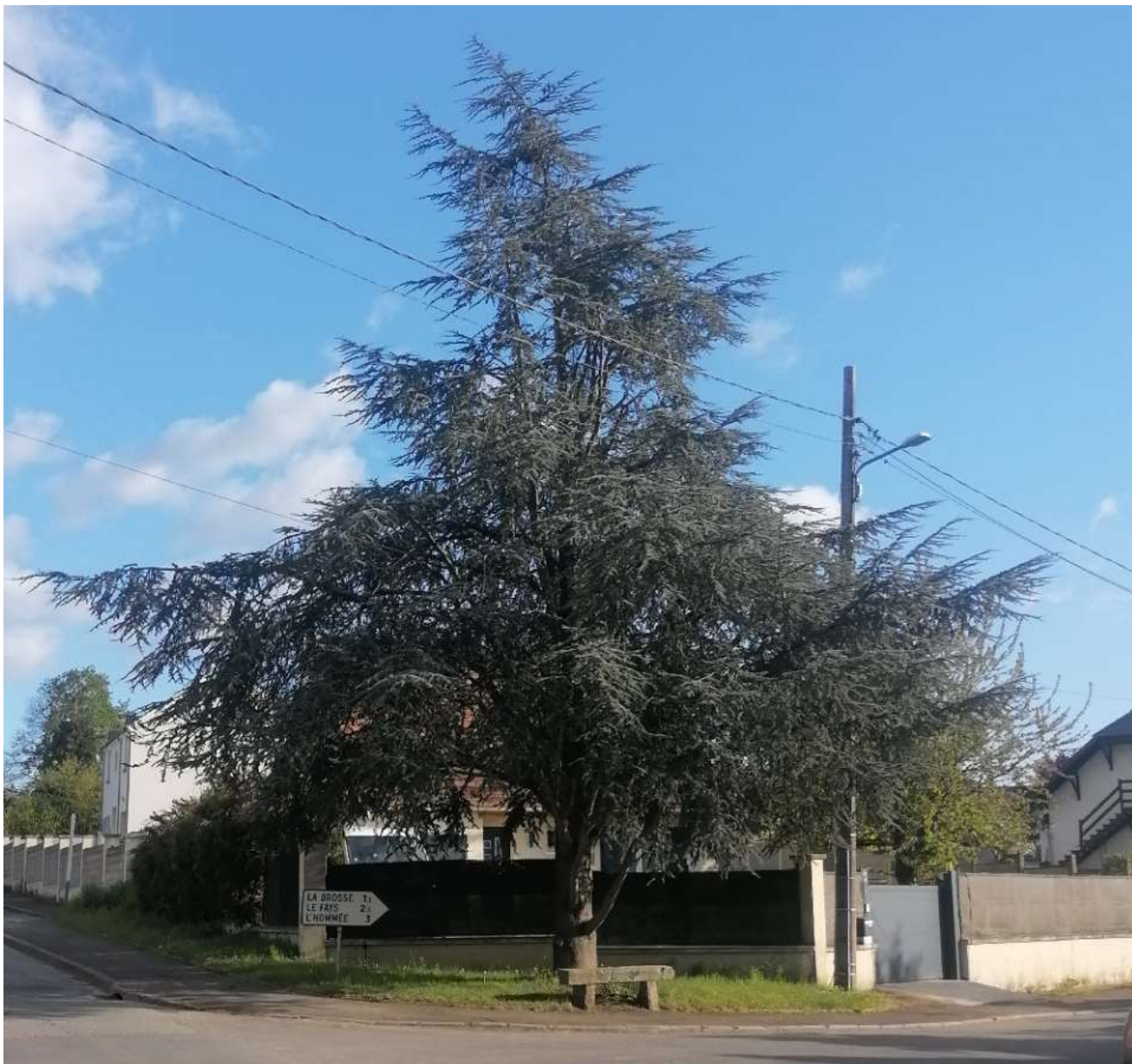
Le cèdre du bicentenaire de la Révolution Française

La Bochetière, La Boulois, La Brosse, Buisson-Bailly, La Cadine, Le Carrouge, Champbonnois, Cofféry, Les Deux Maisons, L'Épauche, Le Fays, La Fresnois, L'Hommée, Malnoue, Le Merger, Le Montcel, Le Petit Choisy, Les Queurses, Le Ru Des Rieux, Les Sablons, La Tuilerie, Villars Les Massons.