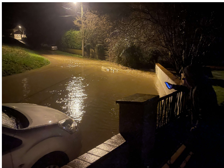
Rue du gué

Les 9 décembre et 26 février, Choisy-en-Brie a fait l'objet de fortes précipitations qui ont généré des inondations à différents endroits dans le village. Plusieurs maisons et jardins ont été touchés, certains à deux reprises.