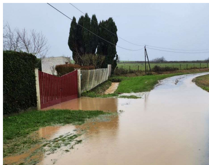
Rue du faubourg